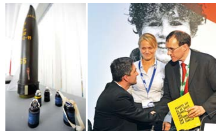
I 80 land En klasebombe står utstilt på et senter for demontering av slike våpen i den tyske byen Luebben.

En ting er det at det gjenstår for medlemmene å oppfylle kravene i konvensjonen. Men viktigere er det at stormakter som USA, Israel, Kina, Russland og India ikke har ratifisert konvensjonen; de fleste av landene som har gjort det ville i de fleste tenkelige scenarier uansett ikke bruke klasevåpen. Av land som faktisk har brukt klasevåpen i krig er det hittil bare Storbritannia og Frankrike som har ratifisert konvensjonen.