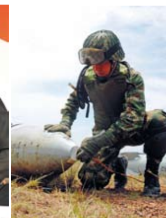
Farlig arbeid Colombia har allerede ødelagt alle sine klasevåpen. Her gjør en våpenekspert fra Colombias hær klart for den kontrollerte detoneringen av en chilensk-laget klasebombe, i mai 2009.